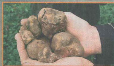
■ Prachtige gladde ronde witte truffels, een delicatessen.

I TALIAANSE witte truffels komen uit Alba, uit de regio Piemonte, wordt meestal gedacht. Dat is lang niet altijd waar. Slechts 3 procent van de Italiaanse truffels komt daar vandaan! De rest komt uit het midden van Italië, vooral uit de regio's Toscane, de Marken en Umbrië. En ook hier zijn uitstekende witte truffels, wordt ons verzekerd.