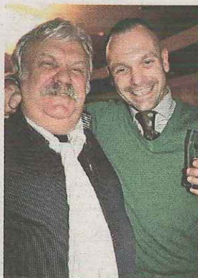
Minevitus senior en Minevitus junior: 'Wij snijden carpaccio met de hand.'